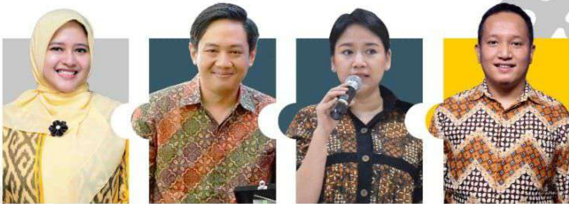
Dosen professional dan kompeten pada bidangnya sesuai mata kuliah yang diampu